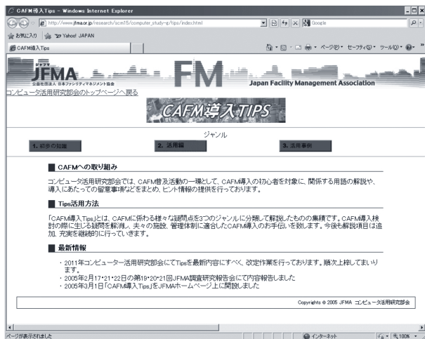
図2 FM 支援ソフトウェアホームページ画面