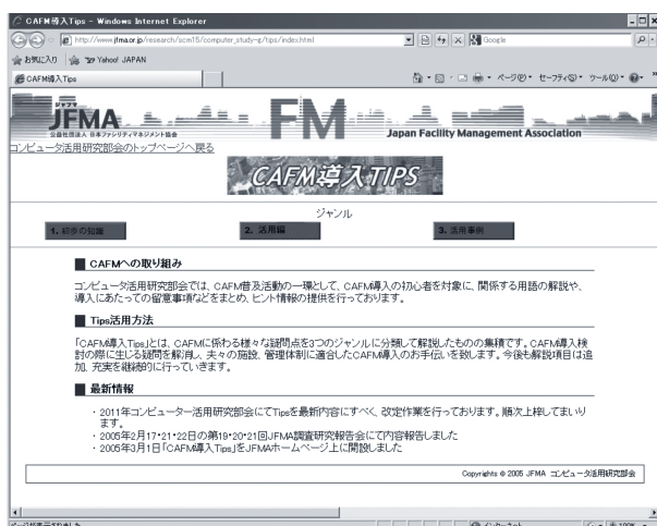
図表1 CAFM 導入 TIPS ホームページ画面