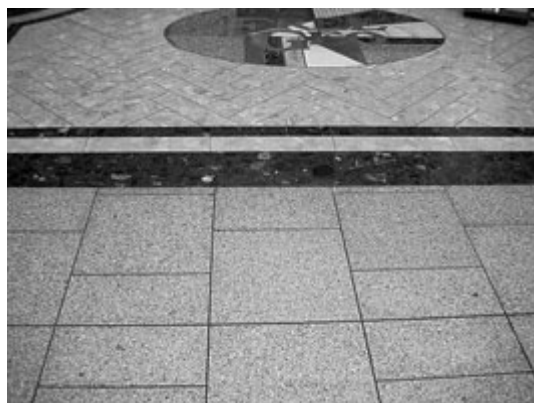
錯覚を誘発するデザイン

天井とその光環境、色彩、素材などの空間全体を一体的に考え、トータルにデザインすることが必要である。