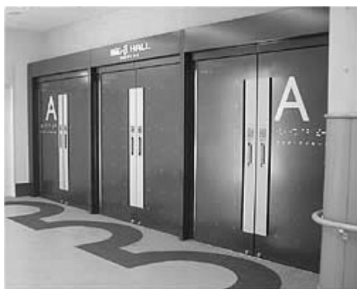
ドアの軌跡を描いた床のパターン

このように素材感の違いを組み合わせ、それを一定のルールとすることで、誘導や危険を喚起させるデザインとして利用することが可能だと考える。また空間のデザイン要素である「光」「色」「素材」と空間構成要素の「床」「壁」「天井」を五感に訴えるようにデザインすることが重要であり、デザインに大きな可能性がある。