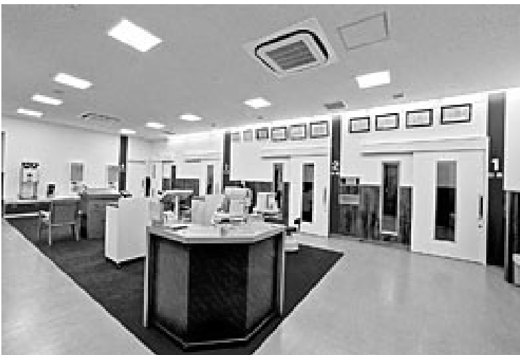
色彩と素材感で歩行エリアをデザインした測定・検査室