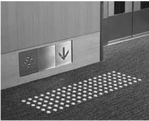
視認性の高い点状ブロックと足元スイッチ