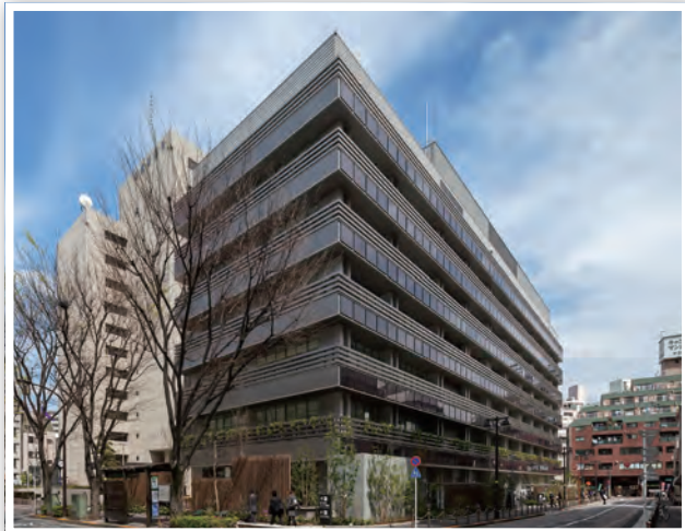
最優秀FM賞（錦澤賞） 東京都板橋区

ファシリティマネジメント(FM)は、人事、財務、ICTとともに コアビジネスを推進する重要な経営基盤です。