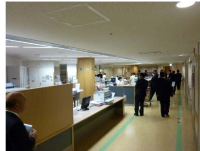
施設調査2011（倉敷中央病院）