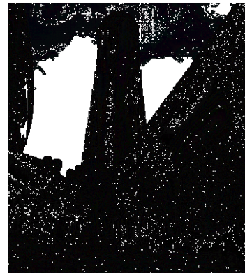
施設調査2013（山口県国際総合センター）