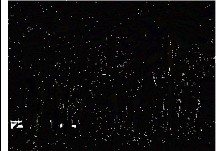
施設調査2012（三菱電機）