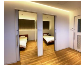
体調がすぐれない時に休憩できる リカバリールーム