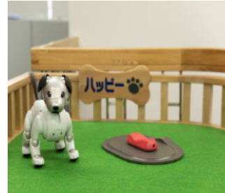
社員の癒し、aiboのハッピー 心の健康と社員の コミュニケーションの活性化にも