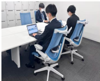
身体負担を軽減する アクトチェア