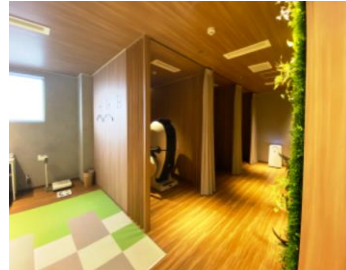
マッサージチェア・仮眠スペース完備 疲れた体と頭をリフレッシュ