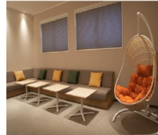
女性更衣室「FLOWER」 「気持ちまで着替えられる」空間です