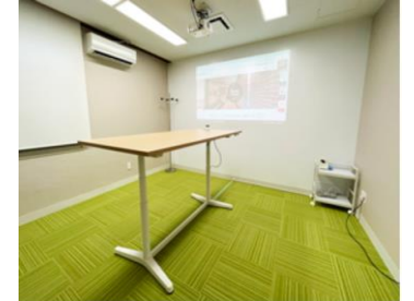
社内全面禁煙に伴い、 喫煙室を立ちミーティングルームへ