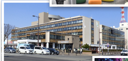
優秀FM賞 日本アイ・ピー・エム株式会社