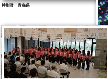
特別賞 宮城県南三陸町