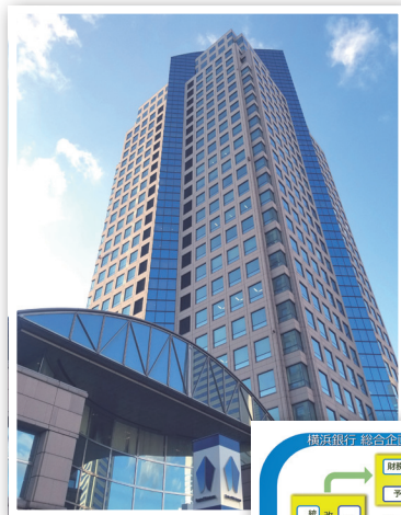
最優秀FM賞 (総澤賞) 株式会社横浜銀行