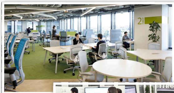
優秀FM賞 三菱地所株式会社